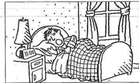
4. el señor Castro